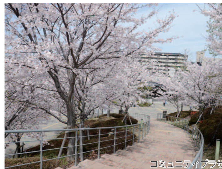
コミュニティプラザ