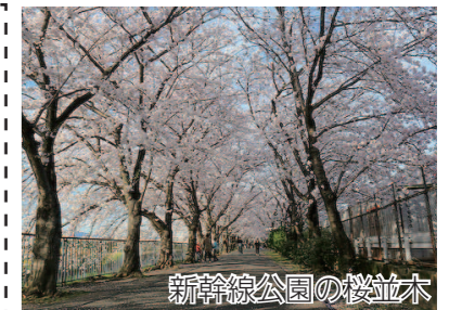
新幹線公園の桜並木

■ 新幹線内部を公開 新幹線の車内や運転席を見学できます。 3月から5月は、毎週日曜日午前10時～12時、午後2時～4時に内部公開しています。 問合せ 水みどり課へ