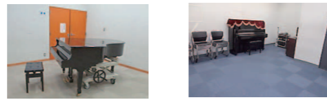
▲安威川公民館 ▲鳥飼東公民館

利用時間 午前9時〜午後10時 ※毎月第4金曜日は休み 利用人数 ▽安威川公民館=20人 ▽鳥飼東公民館=12人 ピアノ利用料 ▽安威川公民館=1,000円(グランドピアノ使用料) ▽鳥飼東公民館=無料 音楽室利用料