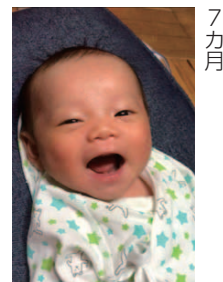
「無事に生まれてきてくれてありがとう!」