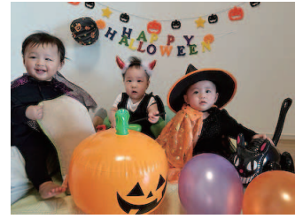
「仲よし3人で初めてのハロウィンパーティ!」