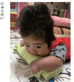
「今話題の爆毛赤ちゃんです! (笑)」