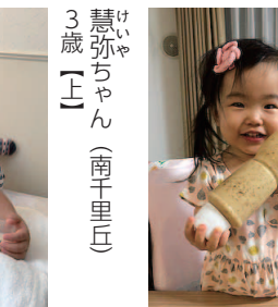
「やんちゃ盛り! 楽しい毎日ありがとう!」