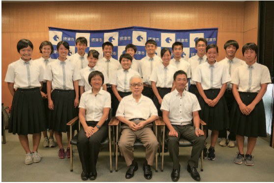
▲ 摂津高校陸上競技部 （7月27日報告）