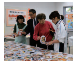
食事バランスのチェック