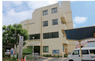
市立休日小児急 病診療所

診療受付時間 日曜・祝日および 12/31～1/3＝午前 9 時半～ 11 時半、午後 1 時～ 4 時