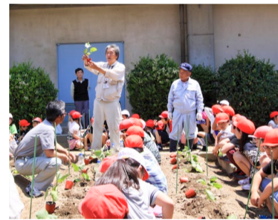
▲6月に行われた鳥飼なすの収穫