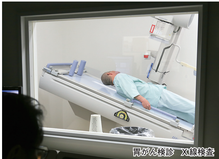
胃がん検診 X線検査