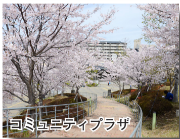
コミユシティプラザ