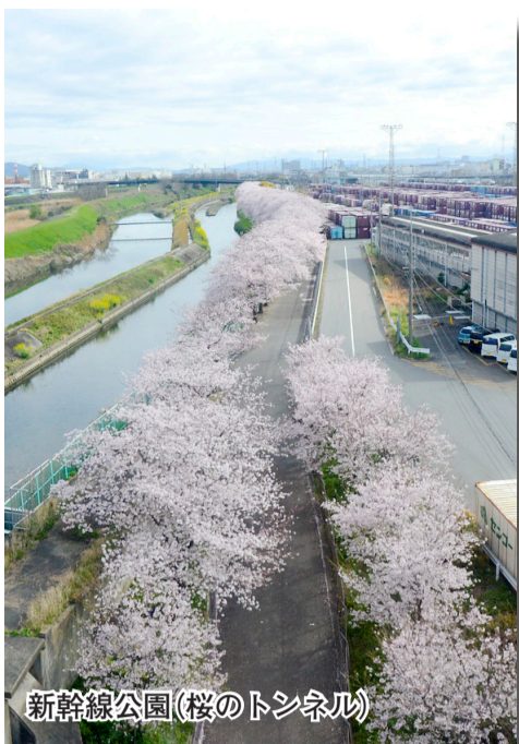
新幹線公園(桜のトンネル)