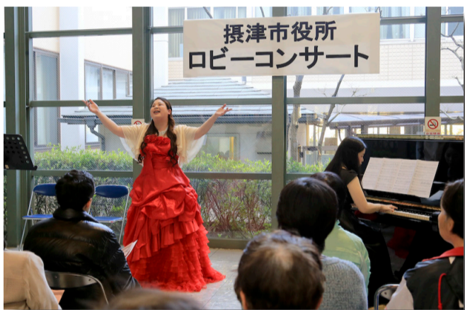
摂津市役所 ロビーコンサート

上級者の部では、玉を手前方向に一回転させてけん先に刺す「うらふりけん」や、8手かけて玉を一周させる「宇宙一周」など高度な技が繰り広げられました。