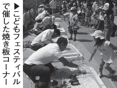
▶こどもフェスティバルで催した焼き板コーナー