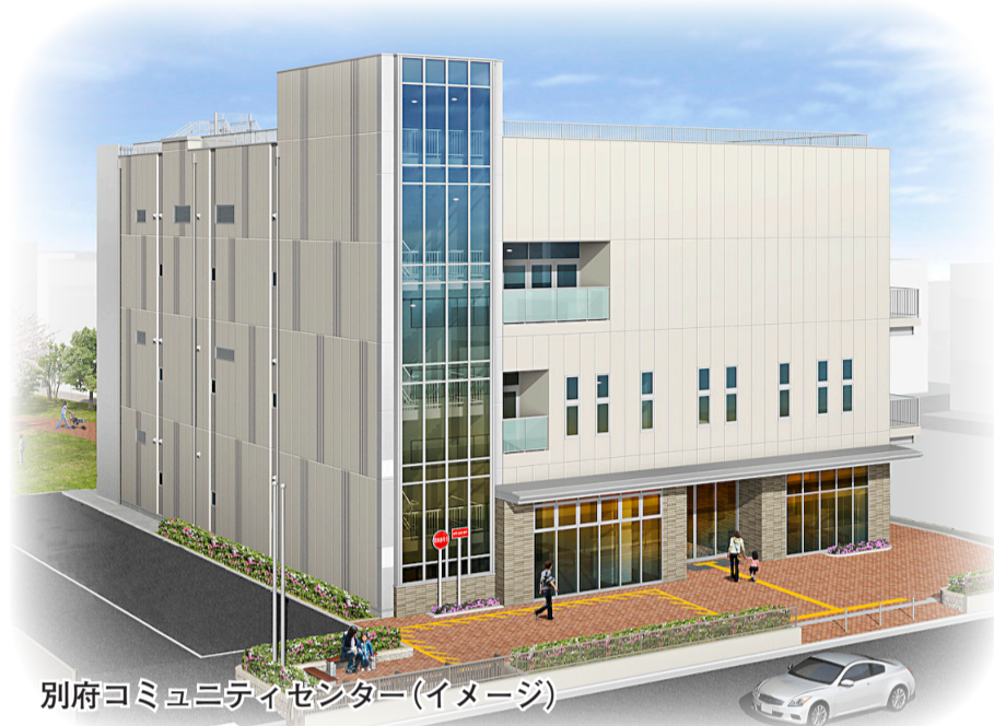
別府コミュニティセンター(イメージ)