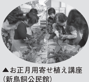
▲お正月用寄せ植え講座(新鳥飼公民館)

◆キッズクッキング体験 12月19日(土)午前10時〜12時 内容 ミニカップケーキ作り 対象 小学生 定員 材料費 18人・2000円 ① 同館へ(☎可・先着)