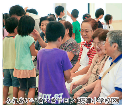
ふれあいいきいきサロン(摂津小学校区)

市が、つどい場の企画・運営を委託している市民団体「つどい場・輪(りん)」は、「この場を通して少しでも健康になって