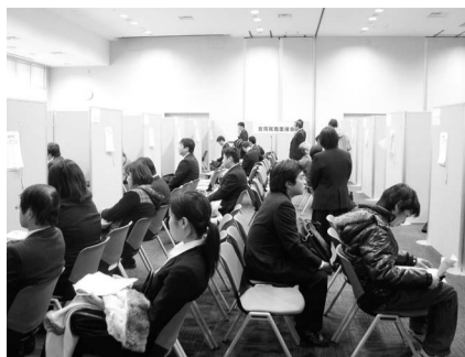
▲市内で実施した合同就職フェア