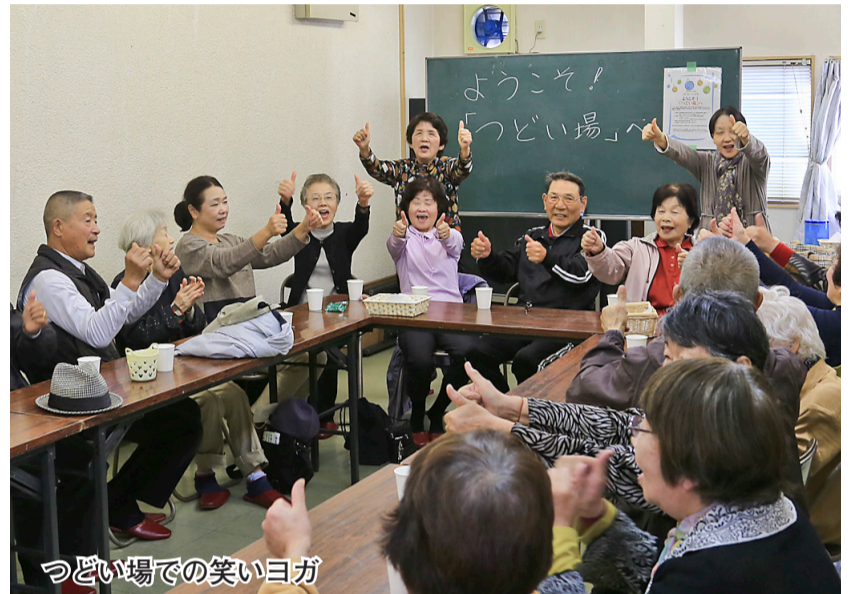
つどい場での笑いヨガ