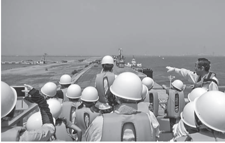
▲環境学習「夏休みエコたんツアー」で訪れたフェニックス

フェニックスでは、ごみの中でも、土砂やがれきなど市で処分しきれない最終ごみや、燃やされて残った灰の処理を受け入れています。毎日、近畿2府4県の168市町村で生活す