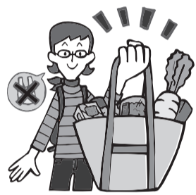
▲マイバック持参でリデュース

p(ピコ)=1兆分の1、n(ナノ)=10億分の1、TEQ=毒性の強さ、Nm 3 =温度0℃・1気圧のもとでの体積