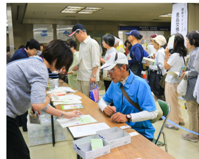
▲市役所での景品交換(9/30)

を対象に、健康づくりで貯めたポイントと交換できる「まちごと元気!ヘルシーポイント事業」を実施しています。ウォーキングでもポイントを貯めることができますので、どんどん歩いてポイントを貯めましょう。※景品をもらうには、健診の受診も必要。 ポイントを貯めるための「健康ノート(ウォーキング6コースも掲載)」は、市役所1階・保健福祉課、保健センター、各公民館で配布しています。