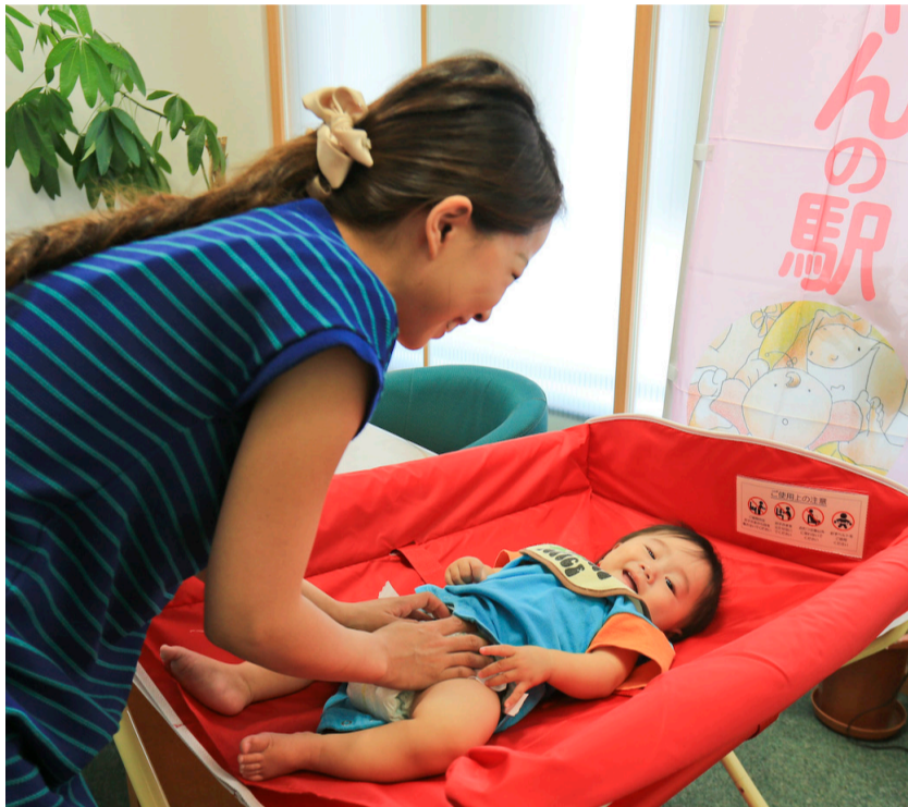
▲池田泉州銀行千里丘支店に設置の赤ちゃんの駅