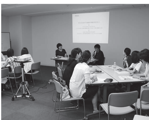
▶7月17日に開催した創業セミナー

起業・創業について、より専門的な相談支援を継続的に行うことができるよう、市商工会と(株)日本政策金融公庫吹田支店に「専門相