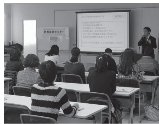
▲産業支援ルーム(南千里丘4-35の3階市商工会隣り)

同ルーム前には、市内各事業所が生産する商品・製品などを展示するスペースを設けています。自由にご覧いただくことができ、市の産業のアピールや販路の拡大などに役立てられるようにしています。展示希望者は、産業振興課へお問い合わせください。