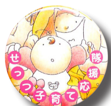
▲子育て応援隊 缶バッジ

市では、子育てを応援する「せつつ子育て応援隊」が活動しています。子どもが泣きやまなくて困っている保護者への声掛けや、階段でベビーカーを持ち運びするときのお手伝いなど、「気軽にできる小さなおせっかい」に取り組んでいます。