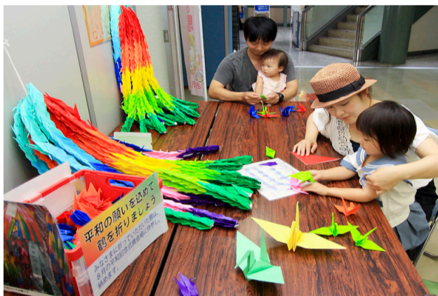
▲7月に各公共施設に設置した「折り鶴コーナー」

日本が終戦を迎えてから今年で70年。当時子ども だった人も今は高齢となり、戦争を知る人の数は少 なくなりました。 二十歳にもならない若者が、戦地で傷を負い亡く なっていました。大勢の子どもたちが、食べるもの がなく飢えていました。私たちが今住んでいるこの 町にも空襲の日々があったのです。 ここに戦争体験者の証言があります。今なお消え ることなく胸に刻まれている戦争の記憶です。 普段の生活の中で戦争を身近に感じることはない かもしれませんが、だからこそ、戦争の悲惨さを知り、 それを伝えていくことが大切です。戦争を二度と繰 り返さないよう、平和への思いを未来へつないでい きましょう。