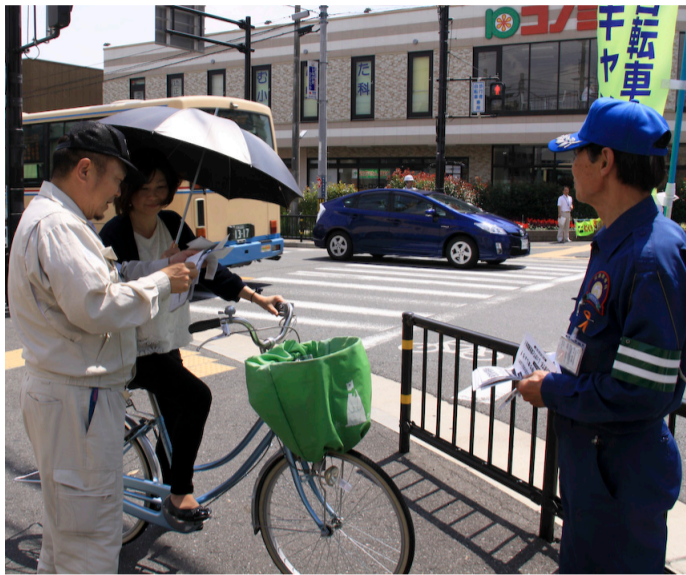
▲片手運転者に指導をする交通安全推進員

自転車は、子どもから高齢者まで多くの人に利用されている乗り物です。しかし、その気軽さから危険な運転による事故が多く、命に関わる重大な事故も発生しています。市では、ルールを守って安全に自転車を運転してもらうよう、平成24年に「自転車安全利用倫理条例」を制定し、さまざまな取り組みを行っています。また、国は道路交通法を改正し、自転車の危険運転者への対策を強化しました。日頃の自転車運転を振り返り、正しい乗り方をして自転車事故をなくしましょう。