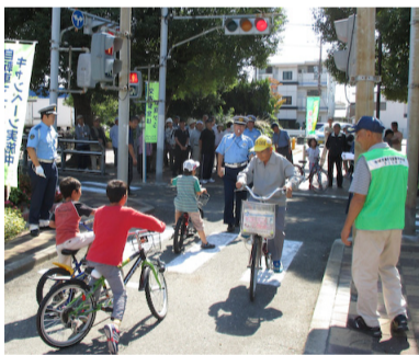
▲三世代交通安全教室

世代と一緒に学ぶ「三世代交通安全教室」を開催しています。昨年は、正雀ちびっこ交通公園を使い、模擬道路や横断歩道を使い、模範となり、子どもに交通ルールの大切さを伝える機会となっています。