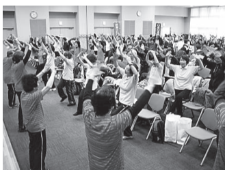
▲健康グループの交流会

市オリジナルの健康体操「摂津みんなで体操三部作」を指導する「はつらつ元気でまっせ講座」を開催し、自主的に健康づくりを行うグループを増やしていきます。また、「まちごとフィットネス！ヘルシータウンせつつ事業」と連携し、ウォーキングや介護予防を進めていきます。