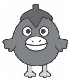
消費生活相談ルーム キャラクター なす丸くん

申請時に年金加入期間の確認などが必要となりますので、詳しくは、お問い合わせください。 問い合わせ 国保年金課国民年金係へ