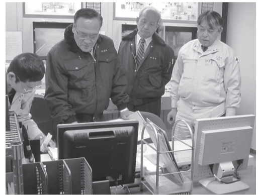
環境センターでの施設監査