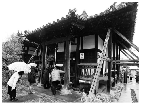
▶ 同像が安置されている護摩堂