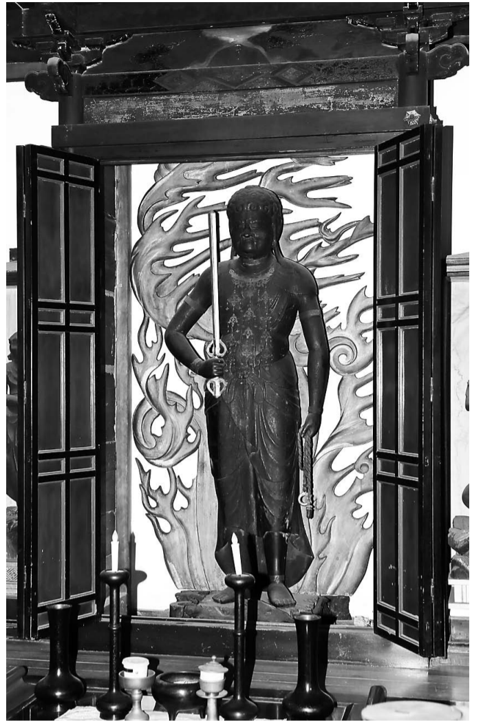
▲ 金剛院の不動明王立像