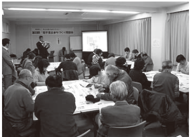
▲南千里丘まちづくり懇談会

新たな計画では、『みんなで作る摂津のまちすごい“わ”』を基本理念として、人と人とのつながりや話し合いの場を大切にする協働のまちづくりを進めていきます。