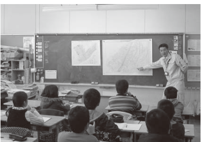
▲三宅柳田小学校で実施した、まちづくりに関する出張授業

本市では、人間基礎教育の提唱とともに、「協働」をまちづくりの柱としています。協働とは、市民・事業者・行政が、それぞれの役割と責務に基づき、対等な立場で、連携・協力し合って、目標の達成を図っていくことを言います。