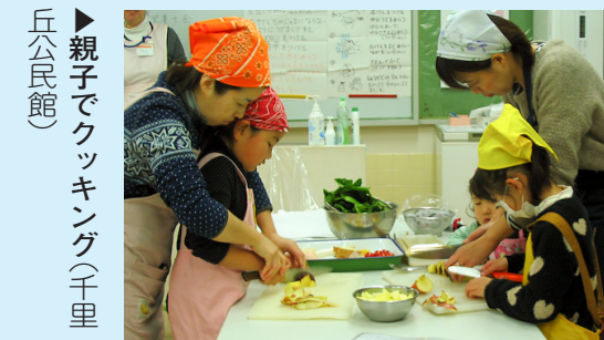
▶ 親子でクッキング(千里丘公民館)

同活動の助成を受けている団体は、現在33団体あります。各団体ではメンバーが協力して水やり