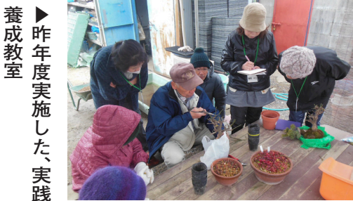
▶ 昨年度実施した、実践養成教室

4月～来年3月の月2回程度午後1時から、鶴野苗圃(鶴野3丁目9-8)で「花と木の実践養成教室」を実施しています。種まきから花苗の育て方、花壇の管理方法、寄せ植えなどを実践で学ぶ教室です。興味のある人は、公園みどり課へお問い合わせください。