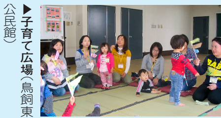
▶ 子育て広場(鳥飼東公民館)