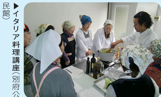
▶ イタリア料理講座(別府公民館)