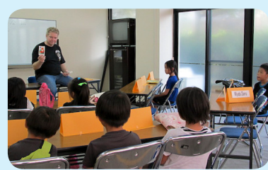
▲ キッズ英会話(味生公民館)