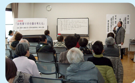
◀ 昨年寄りの介護を考える(安威川公民館)