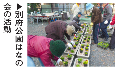
▶ 別府公園はなの会の活動

鶴野苗圃では、地域の緑化活動を広げるために、「実践教室」や、専門の指導員が庭木や草花の育て方・病害虫駆除の方法などの相談に応じる「花とみどりの相談所☎072(632)4687」を開催しています。ぜひご利用ください。