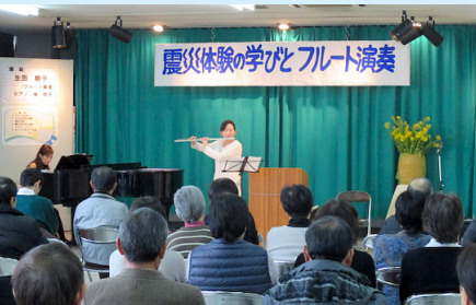
▲ 震災体験の学びとフルーツ演奏(新鳥飼公民館)