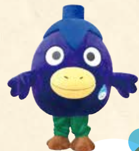
摂津市役所消費生活相談ルームキャラクター なす丸くん