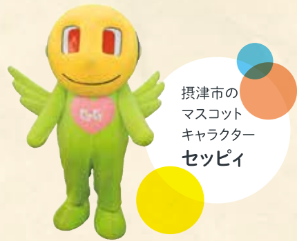
摂津市のマスコットキャラクター セツビィ