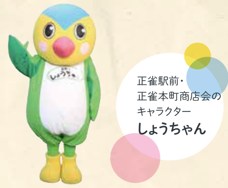
正雀駅前・正雀本町商店会のキャラクター しょうちゃん