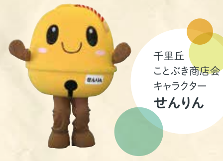
千里丘ことぶき商店会キャラクター せんりん